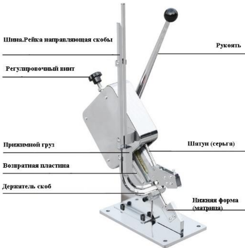
Рис 3. Общий вид оборудования. Клипсатор